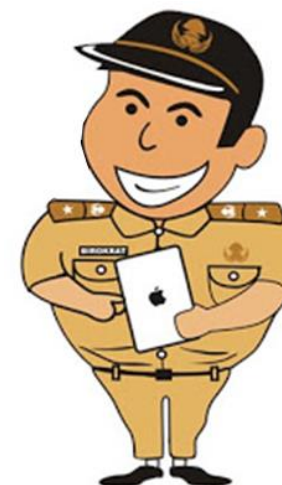
PNS Professional yang berkarakter